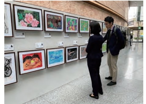
「可能性アートプロジェクト展」の様子

障害のある方が制作した絵画を、自社独自の印刷技術である「プリマグラフィ」を活用して額装し、作品として展示する「可能性アートプロジェクト展」を実施しています。また、プロジェクトを通じて得たユニバーサルデザインの視点を生かして、絵画にスマートフォンをかざすと作品が動き出し、作品に込めた想いを聴くことができる AR コンテンツも制作しました。