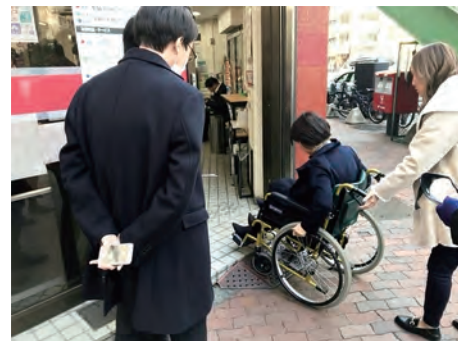
車椅子に乗車して街のバリアを体験する従業員

全国で実施されている様々なスポーツ大会やコンサートなどのイベントで、来場された障害のある方や高齢の方に、会場の説明や案内などのサポートを行うボランティアに協力しています。研修で学んだ内容を実際の活動として実践することが、従業員の成功体験につながり、心のバリアフリーの理念を根付かせています。