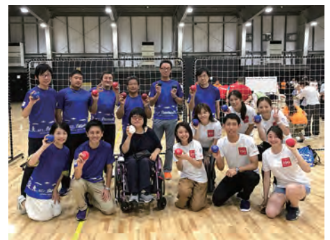
グループ横断のボッチャ大会