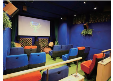
360°音に包まれる森の中をイメージしたユニバーサルシアターの内観

運営母体は、2001年から視覚障害者の映画鑑賞をサポートしてきたボランティア団体であり、ユニバーサルシアターの運営に留まらず、地域の上映会のユニバーサル化についても積極的に協力しています。