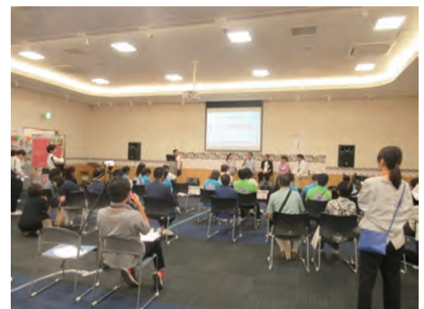
イオンモール日の出で「ハートワークフェア」を開催