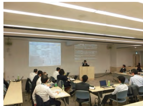
音声を認識し文字化するアプリを活用した会議

1990年代からユニバーサルデザインの考え方に基づく製品開発を行っており、触るだけでリンスと区別できる「きざみ」を付けたシャンプー容器など、業界標準、国際規格になったものもあります。障害当事者等からの意見を積極的に取り入れる中で、社員に「人にやさしいモノづくり」の考え方が根付いています。