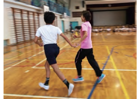
小学校におけるパラスポーツ体験授業

特例子会社に在籍しているブラインドマラソンの選手とブラインドサッカーの選手が講師となり、2018 年度から自治体と連携して地元の小中学校においてパラスポーツの授業を実施しています。児童や生徒が実際のパラスポーツを体験し、障害に対する理解を広げています。