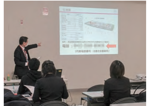
各モールで入館研修を実施

イオンモール日の出では、地元の行政に協力して「ハートワークフェア」を開催しています。モール館内を車椅子で回る体験会を開催するなど、従業員や来館するお客様が障害のある方と直接コミュニケーションを取る場となっており、障害者理解に繋がっています。