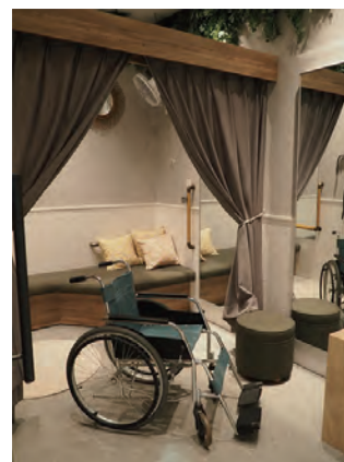
「みんなのフィッティングルーム」