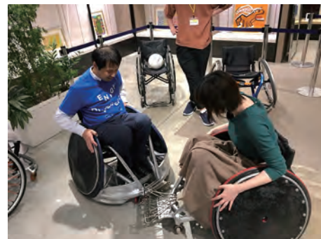
インクルージョンフェスにおけるパラスポーツ体験の様子

現場マネージャーの発案で、障害のある方の声を生かして誰もが気軽に使える「みんなのフィッティングルーム」を設置するなど、これまで試着を諦めていた方々にも利用してもらえる店舗づくりを推進しています。