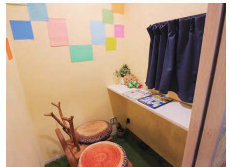
小さなお子様連れでも安心して映画を楽しめる親子鑑賞室