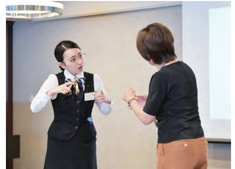
手話コンクールの様子