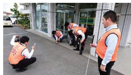
街のバリアフリー情報をアプリに投稿する従業員