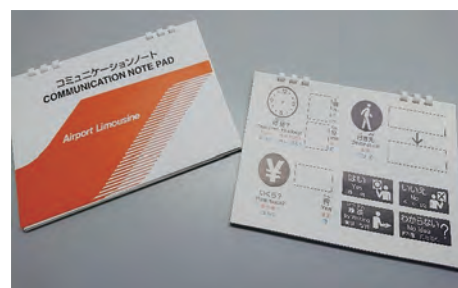
ピクトグラムや外国語を盛り込んで作成したコミュニケーションノート