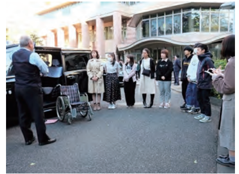
地元の大学でのUDタクシー講習