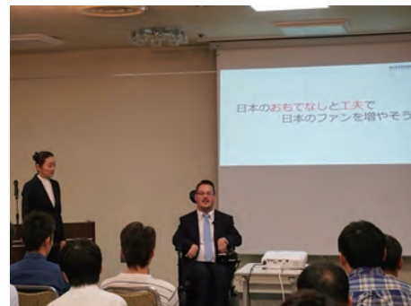
外国人障害当事者の講師による研修の様子

聴覚に障害をお持ちの方や外国の方とのコミュニケーションを円滑にすることを目的に、様々なピクトグラムを印刷した会社オリジナルのコミュニケーションノートを作成し、全ての車両に搭載しています。