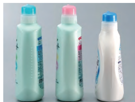
触っただけで中身を区別できるボトル