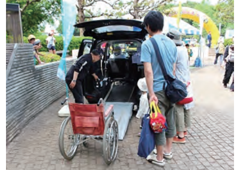
地元の商工祭りでのUDタクシー乗降体験

地元の行政や商工会と連携して、市民祭り及び商工祭りにおいて、UDタクシーの実車展示や車椅子乗降体験を実施しています。これらのイベントには乗務員が毎年参加しており、市民の車椅子利用者に対する理解促進に貢献しています。