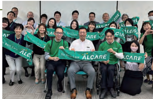
10月は障害の理解を深める月間(2023年開催時)

2015年より、所属パラアスリート社員が小中学生に向けてパラスポーツや自身の障害、車いすの方への声掛けや介助方法について出前授業を行っています。また、オストメイトの社会的認知拡大と理解促進に向け、外部団体が実施するイベントへの協力や防災の日をきっかけとした災害対策などのニュースリリースを発信することで、誰もが自分らしく生きられる社会の実現を目指しています。