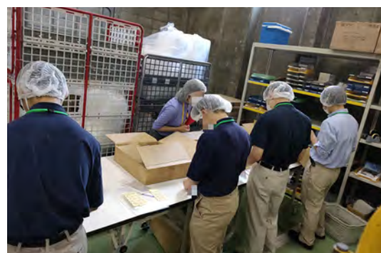
東京都立港特別支援学校とのパートナーシップ実習の様子