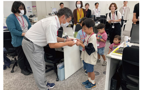
職場参観日で、自作の名刺を社員と交換する体験の様様