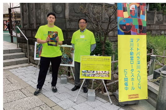
アートパラ深川ボランティア活動への参加